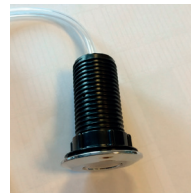
Luftslang ska sitta fast i knappen.

Om kvarnen inte fungerar beror det oftast på att något har fastnat. Dra ur strömsladden , säkerställ att inget fastnat i malkammaren – om något fastnat peta då loss det och kontrollera med insexnyckeln underifrån, att kvarnen kan rotera – detta gäller om du har en ljusgrå kvarn (W5). Har du en svart kvarn (W6) använder du istället losstagningsverktyget för att få loss det som har fastnat i malkammaren. Sätt i strömsladden, tryck på den röda säkringsknappen, vänta en minut – starta kvarnen. Om felet kvarstår kontakta kundtjänst hos din fastighetsägare eller Matavfallssystem. www.matavfallssystem.se