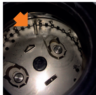
Här fastnar oftast främmande föremål.