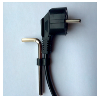
Insexnyckel på sladden.